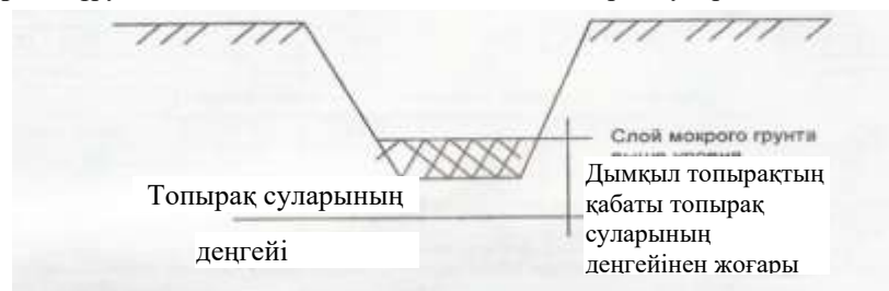
1-сурет. Тұру биіктігі 0 м-ге тең болған кездегі топырақ сулары деңгейінің орналасуы

18 Суды жасанды төмендетумен құбыр желілерін салу барысында «Жер жұмыстары» кестелерінің нормаларына машинистердің еңбекақысын қоса алғанда, жұмысшы құрылысшылардың еңбекақысына, машиналарды пайдалануға материалдардың құнына 2,8 графаларда (2.1÷2.2-кестелердің) және 2,5 графаларда (2.3÷2.4-кестелердің) берілген коэффициенттерді қолдану қажет, ал суды төмендетудің өзінің құнын құрылысты ұйымдастыру жобаларының (ҚҰЖ) деректері негізінде анықтау қажет.